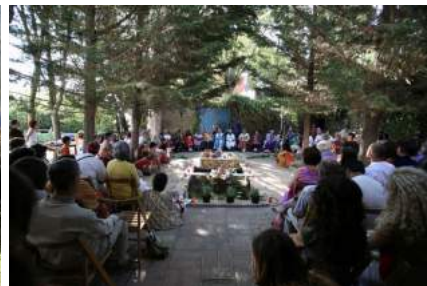
Dama de Elche.