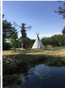
Campa, Tipi, Toten